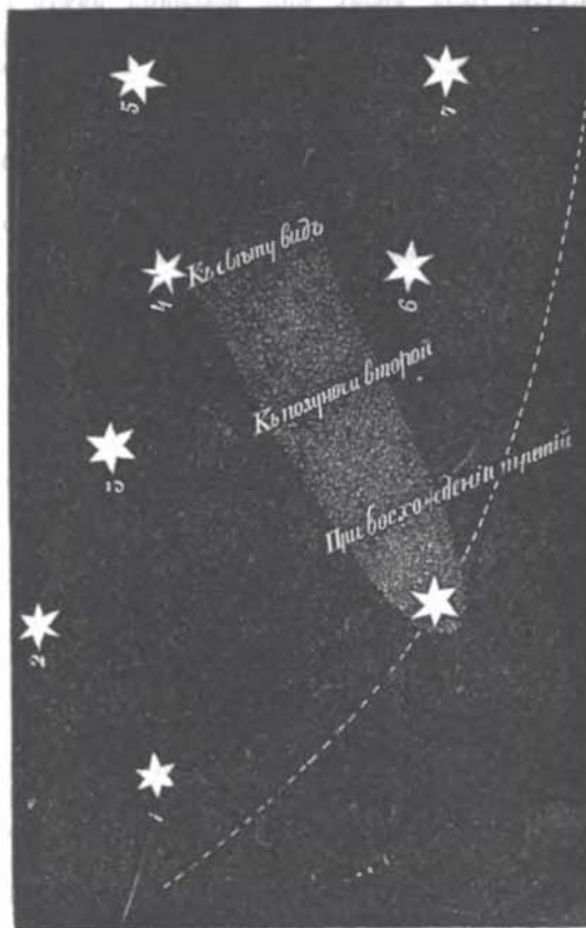
Комета 1811 года.